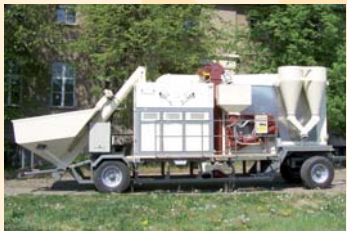
Saatgutanlage mit K-L-Tier und Beizer, bis 12 t/h Seed processing plant with K-L grader and dresser, up to 12 t/hr