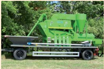
Saatgutbereiter mit Beizer, bis 5 t/h Seed cleaner/grader with dresser, up to 5 t/hr

We can supply the right machine for every job and for every customer. Start using tomorrow's technology today!