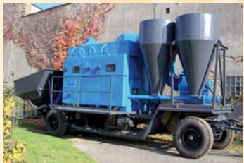
Getreidereinigung Universal bis 80 t/h Universal grain cleaner, up to 80 t/hr