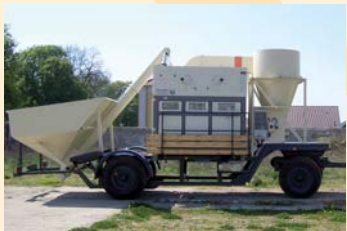
Getreidereinigung Universal bis 60 t/h Universal grain cleaner, up to 60 t/hr